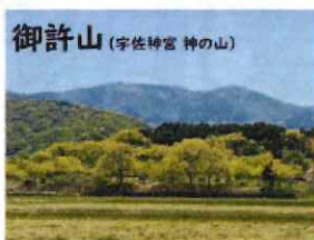
御許山 (宇佐神宮 神の山)