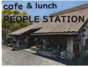
cafe & lunch PEOPLE STATION