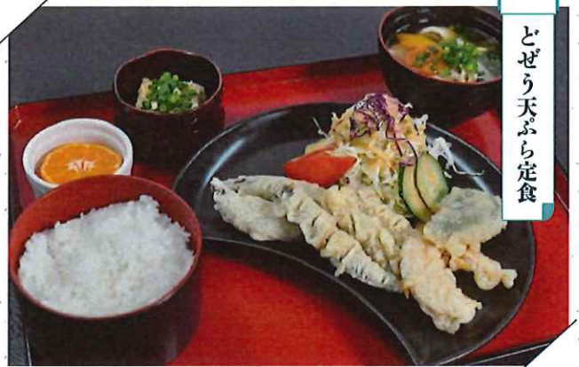
どぜう天ぷら定食

宇佐市四日市54-1 ☎0978-32-2076 〈営業時間〉11:00~14:00、18:00~21:00 〈定休日〉不定休