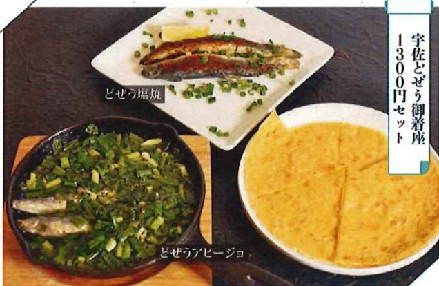
宇佐どぜう御着座 1,300円セット

宇佐市南宇佐2224-1 ☎0978-37-0125 〈営業時間〉11:00~15:00 〈定休日〉不定休