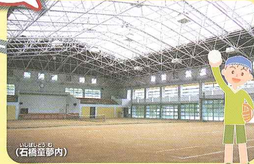
石橋童夢 (石橋童夢内)

平成の森公園 C-3 広大な敷地にスポーツを思いっきり楽しめる施設が備えられ、屋根付き運動広場「石橋童夢」は全天候型施設で、天候に関係なくスポーツやイベントができます。